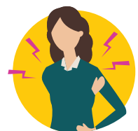
Đau nhức cơ

Có thể tham khảo các triệu chứng phổ biến khác của COVID-19 tại trang www.cdc.gov/coronavirus/2019-ncov/symptoms-testing/symptoms.html .