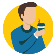
Kamata ke mole namu'i ha me'a pea mo e ifo ho kai