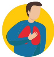
Nounou ho manava