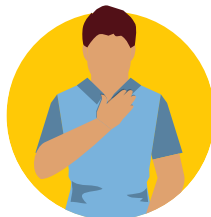
Mamahi pe mamafa ho fatafata pea 'ikai ke sai