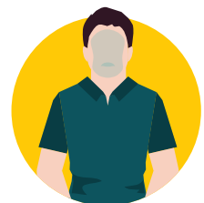
Kapau 'oku lanu pulū ho loungutu pe ko ho fotunga

*'Oku 'ikai ko e kotoa 'eni 'o e ngaahi faka'ilonga fakatu'utamaki. Kapau 'oku ke nofo loto hoha'a ki ai pea ke telefoni ki he toketa.