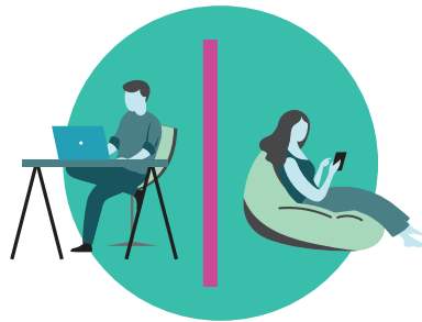
Feinga ke nofo 'i ha loki kehe