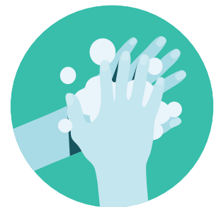
Fūfulu ma'u pe ho ongo nima 'aki ha koa pea mo ha vai.