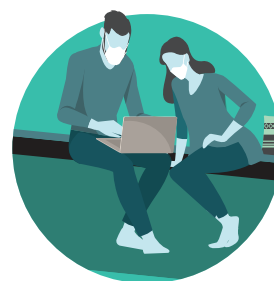
Tui 'o kofu'i ho mata kapau 'oku ke 'alu holo he kakai