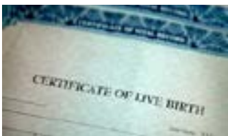
ዝኾነ ዓይነት ሰነድ ስምካ ዘለዎ