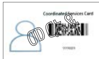
ናይ መንበሪ መለለዩ ካርድ