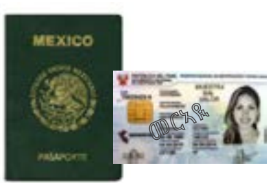
ናይ ወጻኢ ሃገር ዝተፈቐደሉ መንግስታዊ መለለዩ ካርድ

ኣብነታት ገለ ካብ መለለዩ ካርድታት ስምካ ዘለዎ ክትጥቀሙ እትኸእል፡