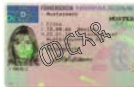
ካብ ካልእ ሃገር ዝመጸ ክትጥቀሙሉ ሓለፋ ዘለዎ