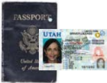
ዕለቱ ዘሕለፈ ፓስፖርት ወይ ፍቓድ መምርሒ መኪና