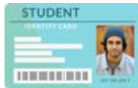
ቤት ትምህርቲ ዘፍቀደሉ መለለዩ ካርድ