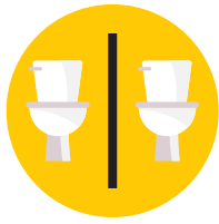
ዝከኣል እንተድኣ ኮይኑ፡ ካብቶም ኣብ ገዛኻ ዘለዉ ሰባት እተፈልዩ ሽቓቕ/መሕጺቢ ሰብነት ተጠቐም።