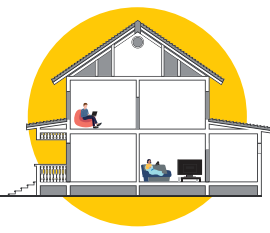
ኣብ ገዛኻ ካብ ካልኦት ሰባት ተፈሊኻ ኣብ ናይ በይንኻ ክፍሊ ተፈለ።