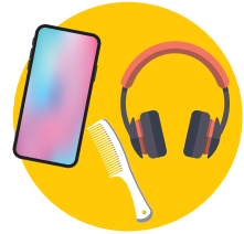
ካልኦት ሰባት ዝጥቀምሉ ውልቃዊ ንብረታት ብዝተኻእለ መጠን ኣይትጠቀም።