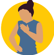
ናይ ምጽትንፋስ ጸገማት ወይ ሕጽረት ምስትንፋስ

ካብዚኣም ዝኾነ ናይ ህጹጽ እዋን ምልክት እንተድኣ ኣለኩም ኮይኑ*፡ተቐላጢፍኩም ሕክምናዊ ሓገዝ ሕተቱ፡