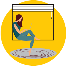
ሕክምናዊ ክንክን ክትገብር እንተድኣ ዘይኳንካ፡ ኣብ ገዛ ጽናሕ።

ዋላ ኣብ ገዛኻ፡ ክሳብ ተነጽሎኻ ዝውዳእ፡ ካብ ካልኦት ብዝተኻእለ መጠን ክትርሕቕ ኣለካ።