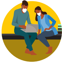
ኣብ ከባቢ ካልኦት ሰባት ክትህሉ ግድን እንተድኣ ኣለካ ኮይኑ፡ ማስክ ግበር።