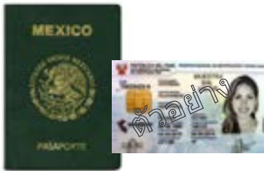
บัตรประจำตัวประชาชนต่างดาวที่ออกโดยรัฐบาล

ตัวอย่างของเอกสารประจำตัวบางประเภทที่คุณสามารถใช้ได้ ซึ่งมีชื่อของคุณอยู่บนเอกสารนั้น ๆ: