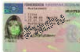
บัตรแสดงสิทธิพิเศษในการขับขี่จากประเทศอื่น