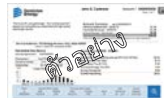
ใบเรียกเก็บค่าน้ำ ค่าไฟ หรือค่าโทรศัพท์