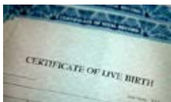
Anumang iba pang dokumento na nandoon ang pangalan mo