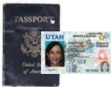
Wala nang bisa na lisensya sa pagmamaneho o pasaporte