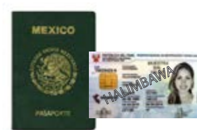
ID na inisyu ng banyagang gobyerno

Mga halimbawa ng ilang uri ng ID na maaari mong gamitin na nandoon ang pangalan mo: