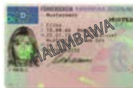
Mga privilege card sa pagmamaneho mula sa ibang bansa