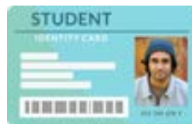
ID na inisyu ng paaralan