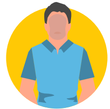
Tongana poro ti yanga mo ouala lè ti mo a soukou

* Sô a yéké â nzörökô ti ngoye ti nangu pèpè. Pika singa na wanganga ti mo tongana mo yéké gi bè ti mo.