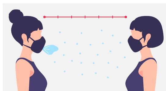
A yeke na nzörökô pèpè Na nzoni tère