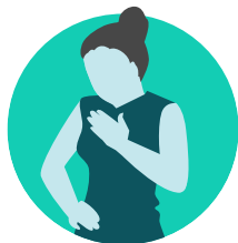
Mo hou gba

Tongana tèreè ti mo a soh mingui, mo iri wanganga iyoh. A nzoroko ti kobela ni ayèkè*: