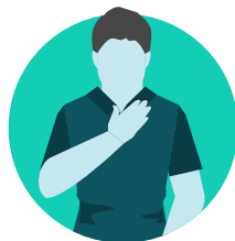
Katè ti mo a soh mingui