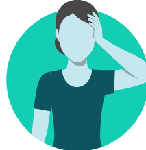
Kpalé ti zingo na lango