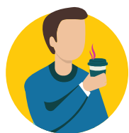
Faaitiitia le mafai ona sosogi poo le tofo