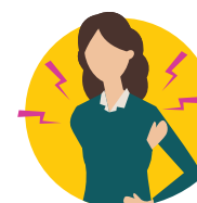
Tiga musele ma isi tiga

E maua isi auga masani o le COVID-19 i le www.cdc.gov/coronavirus/2019-ncov/symptoms-testing/symptoms.html .