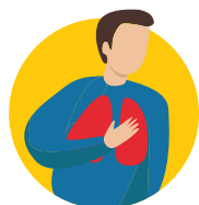
Puupuu le manava