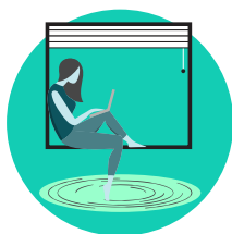
nofo i lou fale