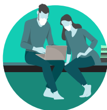
Afai e te ma'i ma ua e manaomia e te latalata atu nai lo le 6 futu mai le isi tagata o lou aiga, e tatau ia oulua uma ona fai ni ufi faagoma'i o foliga