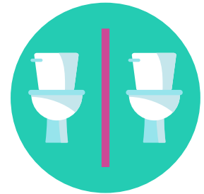
Fa'aaoga se isi fale taele e ese mai i le fale taele e fa'aaoga e isi tagata