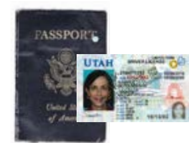
Miyat zaiya soloiyar laiséns yáto paáspouth