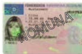
Oinno decór garí sólar haás kaádh