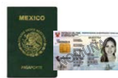
Arekdec óttu diyéde hókumot or ID

Oñne estemal gori faroude késsu ID ír kisím or mesál zeçe oñnor nam táibou: