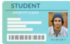
کارت شناسایی صادره از مدرسه