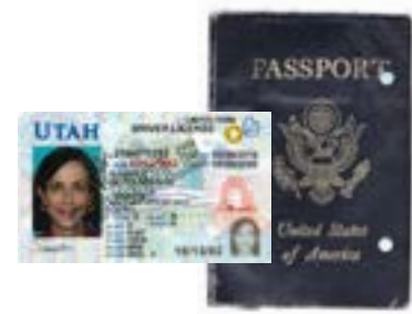
گواهینامه رانندگی یا گذرنامه منقضی شده