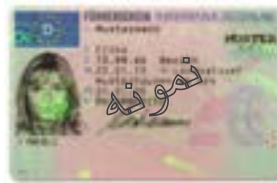
گواهینامه رانندگی ویژه صادره از کشوری دیگر