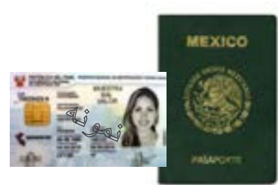
کارت شناسایی صادره از دولت خارجی