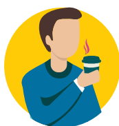
کاهش حس بویایی یا چشایی