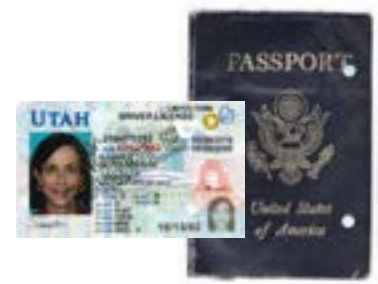
لایسنس رانندگی یا پاسپورت انقضاء شده