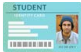
شناسنامه صادر شده از طرف مکتب