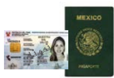
شناسنامه صادر شده از طرف حکومت خارجی