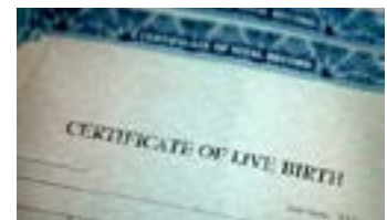
هرگونه سند دیگری که نام شما در آن درج باشد