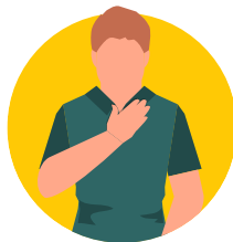
Mpasi to matungisi na kati ya ntolo oyo ezosila te