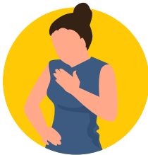
Kopema mpasi to mpema ezokatana

Soki oza na moko ya bilembo ya urgence*, luka lalisali ya monganga nokinoki: