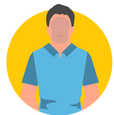
Soki mbebo to elongi nayo eza bleu

*Oyo eza te bilembo nyonso ya urgence. Benga dokotolo na yo soki ozali komitungisa.