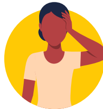
Obulungani to ozolamuka na mpasi