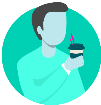
후각 또는 미각 둔화