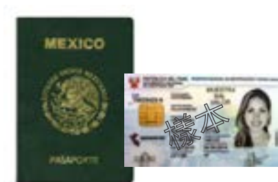
外國政府核發的身份證