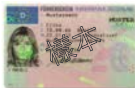
其他國家核發的的駕駛資格卡