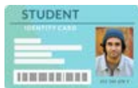
學校核發的身份證