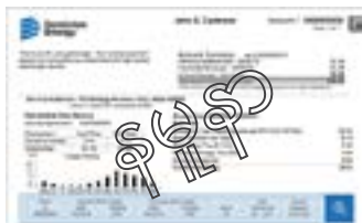
ရေမီး အသုံးစရိတ် တောင်းခံလွှာ