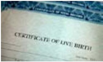
သင့်အမည်ပါသည့် အခြား မည်သည့် စာရွက်စာတမ်း မဆို