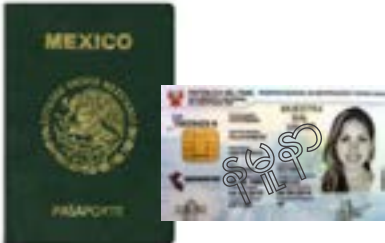
နိုင်ငံရပ်ခြားမှ ထုတ်ပြန်ထားသည့် အစိုးရ သက်သေခံကတ် (ID)

သင်အသုံးပြုနိုင်သည့် သင့်အမည်ပါရှိသော သက်သေခံကတ် (ID) အမျိုးအစားအချို့အတွက် ဥပမာ-