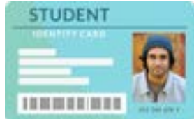
ကျောင်းမှထုတ်ပေးသည့် သက်သေခံကတ် (ID)