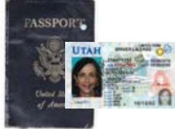
သက်တမ်းကုန်ပြီးသား ယာဉ်မောင်း လိုင်စင် သို့မဟုတ် နိုင်ငံကူးလက်မှတ်