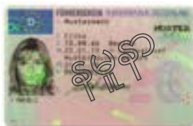
အခြားနိုင်ငံမှ အခွင့်ထူးရ ယာဉ်မောင်း ကတ်များ