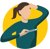
དྲོད་འབར།

ཁྲིད་ར་བ་ཅིན་ ཀོ་མིན-༡༩གི་ ནད་རྟགས་ཚུ་བརྟེན་ཞིན་མ་ལས་ དུས་འཕམ་ལས་བརྟེན་དཔུང་འབད།