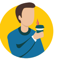
དྲིམ་མན་ནི་ ཡང་ན་ སློམ་ཚོར་ནི་མར་ཕབ།