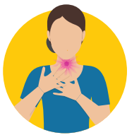
ཨོལ་སློག་གི་མ།