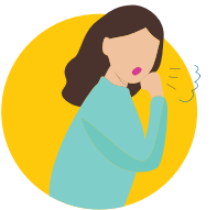
སློ་འབར་ནི

(དྲོད་ཤུགས་༡༠༠.༤ ས་ལེན་ཉེར་ཡང་ན་ དྲོད་ཚད་༣༨ ཡང་ན་ མཐོ་དུགས་ ཡང་ན་ སེམས་འཚབ་དུག་ཡོ་སྤྱད་ནི)