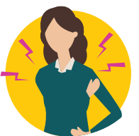
ག་རྩུས་ན་ནི་དང་ བ་རྩུག་ཡོག་ནི