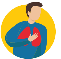
དབུགས་བཟང་མ་ཚུགས།