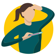
དྲོད་འབར

(དྲོད་ལུགས་ཀྱི་ཉིན་མོ་ ཡ་ཟེན་ཉེར་ཡང་ན་ དྲོད་ཚད་མེད་པར་ ཡང་ན་ མཐོ་དྲགས་ ཡང་ན་ སེམས་འཚབ་དྲག་པོ་ལྟེང་ནི།)