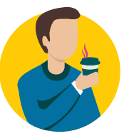
དྲིམ་མན་མ་ནི་ ཡང་ན་ རྩོམ་ཚོར་ནི་མར་ཕབ།