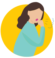
སྟོན་འབར་ནི

(དྲོད་ལུགས་ཀྱི་ཉིན་མོ་ ཡ་ཟེན་ཉེར་ཡང་ན་ དྲོད་ཚད་མེད་པར་ ཡང་ན་ མཐོ་དྲགས་ ཡང་ན་ སེམས་འཚབ་དྲག་པོ་ལྟེང་ནི།)