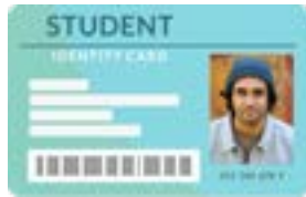
بطاقة هوية مدرسية