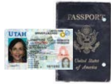
رخصة قيادة أو جواز سفر منتهي الصلاحية