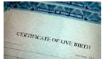
أية وثيقة أخرى عليها اسمك