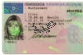
بطاقات امتيازات القيادة من دولة أخرى